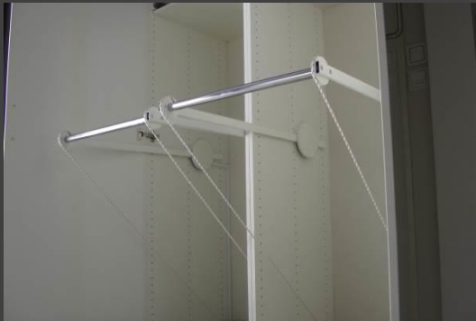
Fra udredningsbolig i Tåstrup