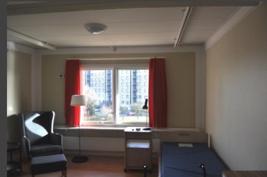
Fra omsorgshotellet Vikærgården i Århus